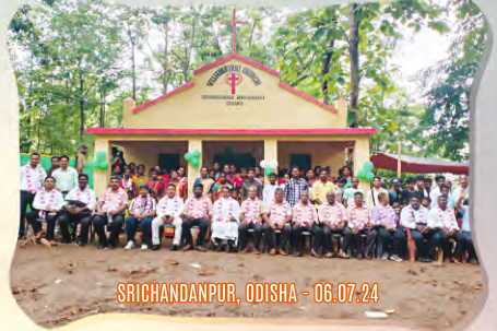
SRICHANDANPUR, ODISHA - 06.07.24