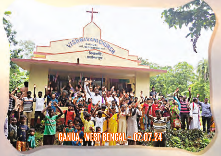
GANUA, WEST BENGAL - 07.07.24