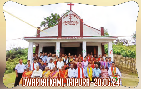
DWARKAI KAMI, TRIPURA - 20.06.24