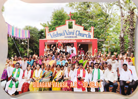
SIDAGAM VALASA, A.P. - 30.06.24