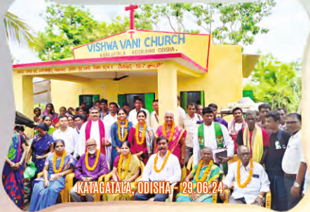
KATAGATALA, ODISHA - 29.06.24

మొదటితరం విశ్వానులు ఉత్తరప్రదేశ్ నుండి ఆంధ్రప్రదేశ్ వరకు 17 నూతన మందిరాలలో ఆరాధిస్తున్నారు. యేసు కారకు ప్రకాశిస్తు సాక్ష్యంలాగా ఉన్నారు. హాలియాయా!