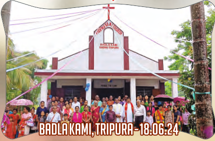
BADLAKAMI, TRIPURA - 18.06.24