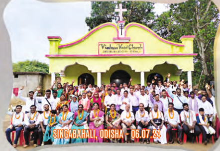
SINGABHAL, ODISHA - 06.07.24