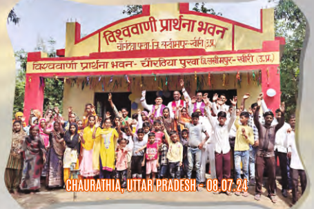
CHAURATHIA, UTTAR PRADESH - 08.07.24