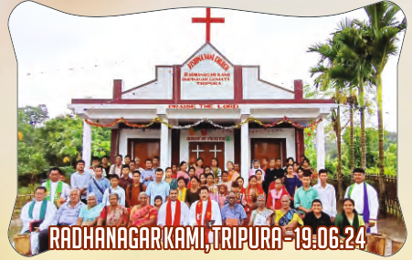
RADHANAGAR KAMI, TRIPURA - 19.06.24