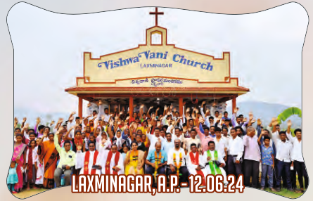
LAXMINAGAR, A.P. - 12.06.24