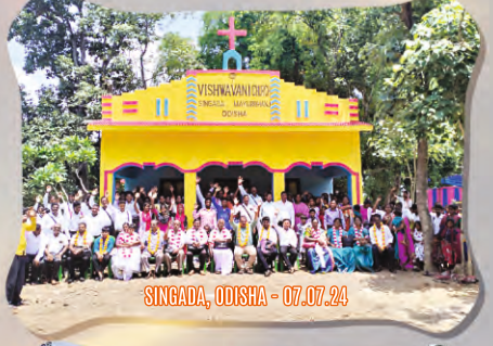
SINGADA, ODISHA - 07.07.24