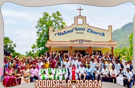
PODDISA, A.P. - 23.06.24