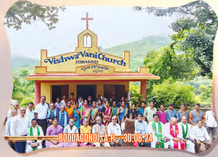
BODDAGONDI, A.P. - 30.06.24