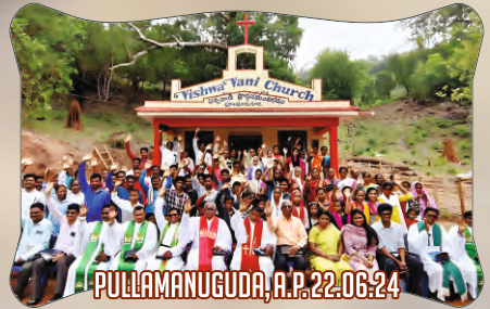
PULLAMANUGUDA, A.P. - 22.06.24