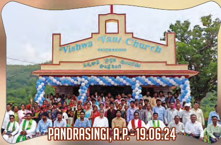
PANDRASINGI, A.P. - 19.06.24