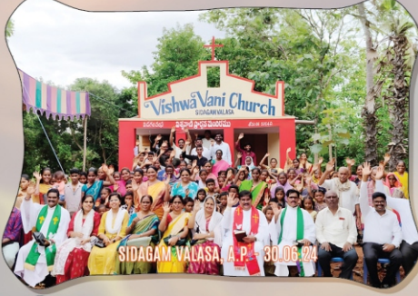
SIDAGAM, VALASA, A.P. - 30.06.24