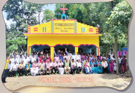
SINGADA, ODISHA - 07.07.24