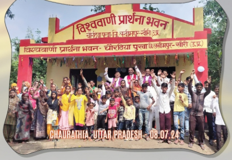
CHAURATHIA, UTTAR PRADESH - 08.07.24