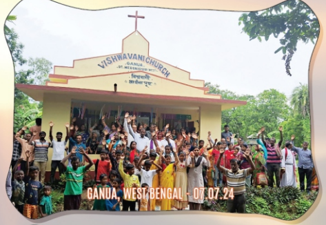
GANDA, WEST BENGAL - 07.07.24