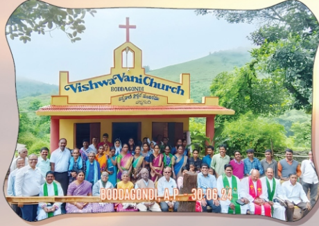
BUDDAGONDI, A.P. - 30.06.24