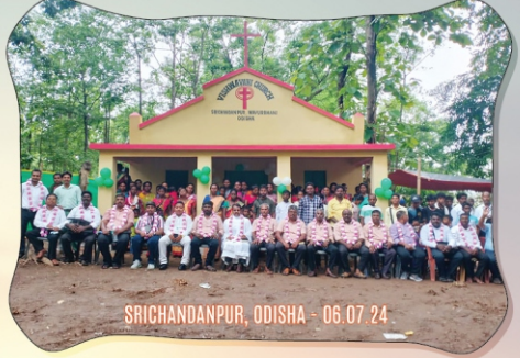
SRICHANDANPUR, ODISHA - 06.07.24