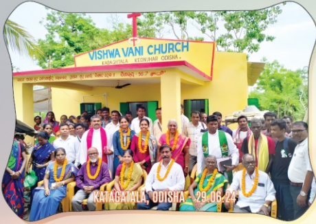
KATAGAILA, ODISHA - 29.06.24

உத்தரப் பிரதேசம் முதல் ஆந்திரப் பிரதேசம் வரை களங்கள் கண்ட 17 புதிய ஆலயங்களில் கூடி ஆராதிக்கும் முதல் தலைமுறை விசுவாசிகள் எழும்பிப் பிரகாசிக்கிறார்கள், இயேசுவைப் பிரதிபலிக்கிறார்கள், அல்லேலூயா!