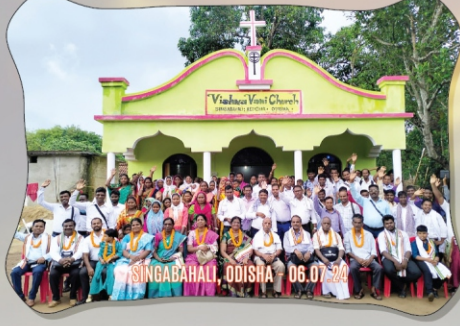
SINGABAHAL, ODISHA - 06.07.24