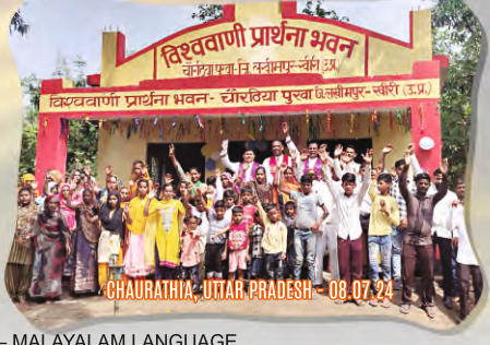
CHAURATHIA, UTTAR PRADESH - 08.07.24

VISHWA VANI SAMARPAN – MALAYALAM LANGUAGE