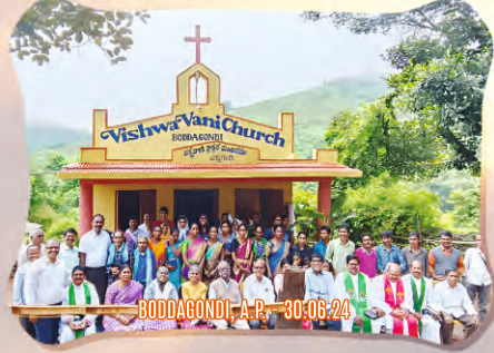
BODDAGONDI, A.P. - 30.06.24