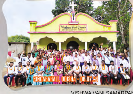
SINGABHAL, ODISHA - 06.07.24