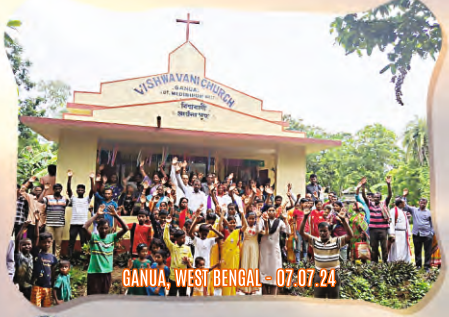
GANUA, WEST BENGAL - 07.07.24