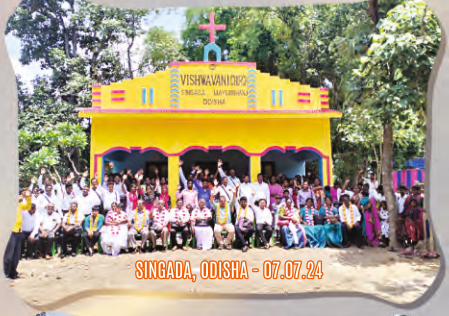
SINGADA, ODISHA - 07.07.24