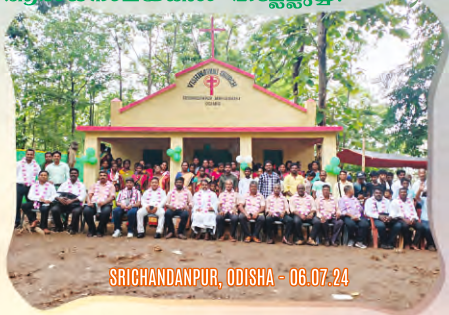
SRICHANDANPUR, ODISHA - 06.07.24