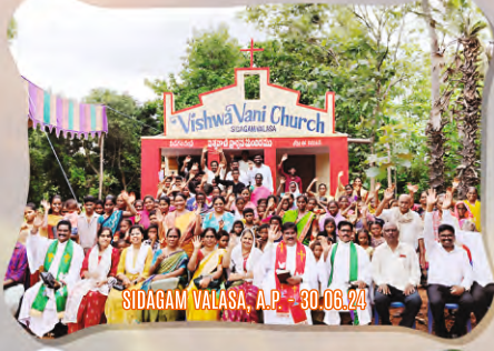
SIDAGAM VALASA, A.P. - 30.06.24