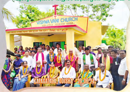
KATAGATALA, ODISHA - 29.06.24

ഉത്തരപ്രദേശ് മുതൽ ആന്ധ്രപ്രദേശ് വരെയുള്ള വയലുകളിലെ ആദ്യതലമുറ വിശ്വാസികൾ ആരാധിക്കുന്ന പുതിയ 17 ആരാധനാലയങ്ങൾ- ഹല്ലേല്ലൂയ്യ!