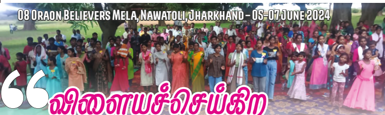
08 ORAON BELIEVERS MELA, NAWATOLI, JHARKHAND - 05-07 JUNE 2024