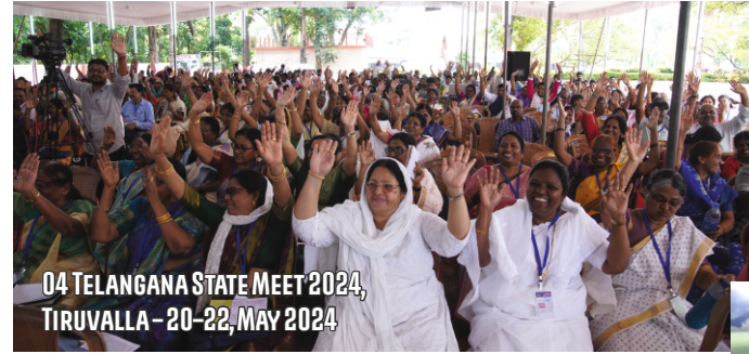
04 TELANGANA STATE MEET 2024, TIRUVALLA - 20-22, MAY 2024