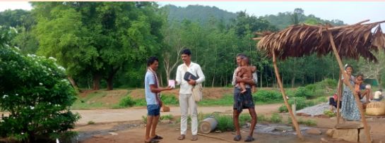
கர்த்தராகிய இயேசு கிறிஸ்துவின் மகிமையின் சுவிசேஷம் இந்நீதியக் கிராமங்களை ஆசீர்வதிப்பதைக் காண்பதே விஷ்வவாணியின் துரிசனம்!