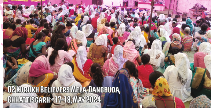
02 KURUKH BELIEVERS MELA, DANGBUDA, CHHATTISGARH - 17-18, MAY 2024