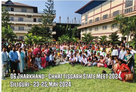
06 JHARKHAND - CHHATTISGARH STATE MEET 2024, SILIGURI - 23-25, MAY 2024