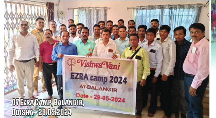
07 EZRA CAMP, BALANGIR, ODISHA - 29.05.2024