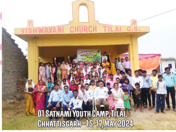
01 SATNAMI YOUTH CAMP, TILAI, CHHATTISGARH - 15-17, MAY 2024

ஒரு இலட்சம் கிராமங்களைப் பணிவிடையாளர்களின் பாதங்கள் எட்டும் வரை தொடரட்டும் தேவ ஜனங்களின் ஒன்றுதிரளுதல்; படரட்டும் பரம இராஜ்யத்தின் நற்செய்தி!