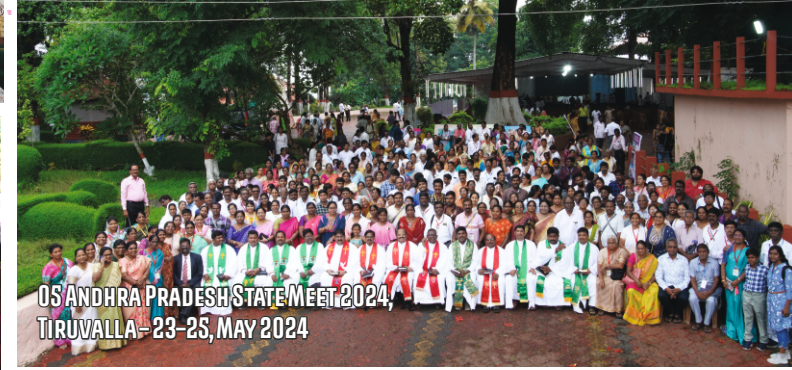
05 ANDHRA PRADESH STATE MEET 2024, TIRUVALLA - 23-25, MAY 2024