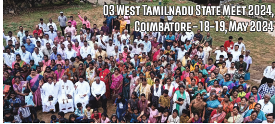
03 WEST TAMILNADU STATE MEET 2024, COIMBATORE - 18-19, MAY 2024