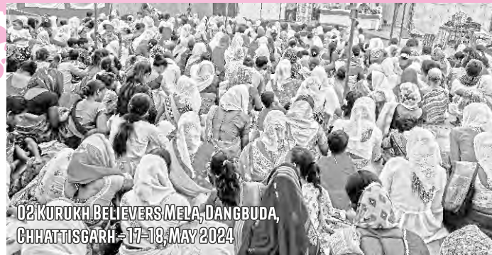
02 KURUKH BELIEVERS MELA, DANGBUDA, CHHATTISGARH - 17-18, MAY 2024