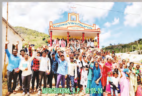
MURCHUKONA, A.P. - 19.05.24