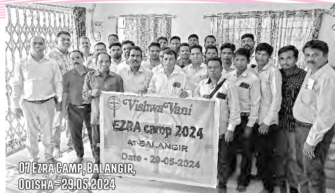
07 EZRA CAMP, BALANGIR, ODISHA - 29.05.2024