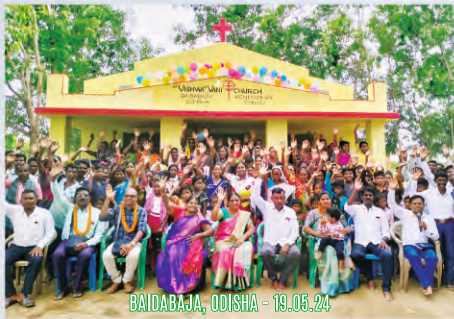
BAIDABAJA, ODISHA - 19.05.24