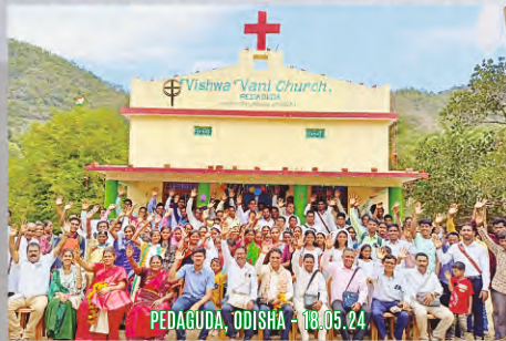
PEDAGUDA, ODISHA - 18.05.24