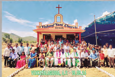
VENKAYALAGEDDA, A.P. - 19.05.24