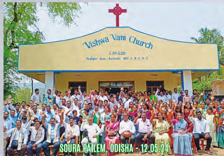
SOURA BAILEM, ODISHA - 12.08.24

ସମୟ ଆସୁଥିଲେ ଯଦ୍ୱାରା ସମସ୍ତ ସ୍ଥାନରେ ଲୋକମାନେ କେବଳ ପ୍ରଭୁ ଯାଶୁଖ୍ରୀଷ୍ଟଙ୍କ ଉପାସନା କରୁଥିବେ । ପରମେଶ୍ୱରଙ୍କ ପ୍ରଣୀତ ହେଉ ।