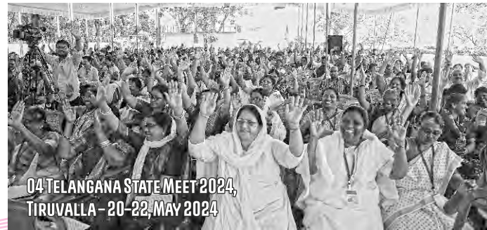
04 TELANGANA STATE MEET 2024, TIRUVALLA - 20-22, MAY 2024

ସେବାକାର୍ଯ୍ୟର ଦର୍ଶନ ସମ୍ପନ୍ନୀୟ ବୀଜ ରାଜ୍ୟ ସ୍ତରୀୟ ବିଶ୍ଵାସୀ ସମାବେଶ, ଲୋକଦଳର ମେଳା, ଆତ୍ମାଲାଭ ପାଇଁ ଯୁବବନ୍ଧୁ ମାନଙ୍କର ତାଲିମ ଓ ଏକ୍ସା କ୍ୟାମ୍ପ ମାଧ୍ୟମରେ ବଦଳ କରାଯାଇଅଛି । ଏହି ବୀଜ ଯେପରି ୩୦, ୬୦ ଏବଂ ୧୦୦ ଗୁଣ ଫଳ ଧାରଣ କରିବ ସେଥିପାଇଁ ପ୍ରାର୍ଥନା କରନ୍ତୁ ।