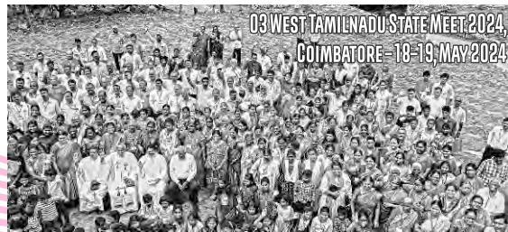
03 WEST TAMILNADU STATE MEET 2024, COIMBATORE - 18-19, MAY 2024