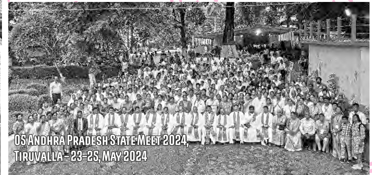
05 ANDHRA PRADESH STATE MEET 2024, TIRUVALLA - 23-25, MAY 2024

ସେବାକାର୍ଯ୍ୟର ଦର୍ଶନ ସମ୍ପନ୍ନୀୟ ବୀଜ ରାଜ୍ୟ ସ୍ତରୀୟ ବିଶ୍ଵାସୀ ସମାବେଶ, ଲୋକଦଳର ମେଳା, ଆତ୍ମାଲାଭ ପାଇଁ ଯୁବବନ୍ଧୁ ମାନଙ୍କର ତାଲିମ ଓ ଏକ୍ସା କ୍ୟାମ୍ପ ମାଧ୍ୟମରେ ବଦଳ କରାଯାଇଅଛି । ଏହି ବୀଜ ଯେପରି ୩୦, ୬୦ ଏବଂ ୧୦୦ ଗୁଣ ଫଳ ଧାରଣ କରିବ ସେଥିପାଇଁ ପ୍ରାର୍ଥନା କରନ୍ତୁ ।