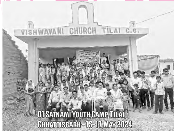
01 SATNAMI YOUTH CAMP, TILAI, CHHATTISGARH - 15-17, MAY 2024

ଏକ ଲକ୍ଷ ଗ୍ରାମକୁ କାର୍ଯ୍ୟକାରୀମାନେ ନ ପହଞ୍ଚିବା ପର୍ଯ୍ୟନ୍ତ ତଥା ସର୍ଗ ରାଜ୍ୟର ସୁସମାଚାର ଘୋଷଣା ନ କରିବା ପର୍ଯ୍ୟନ୍ତ ପରମେଶ୍ଵରଙ୍କ ସନ୍ତାନସନ୍ତତି ମାନେ ଏକତ୍ର ହୁଅନ୍ତୁ ।