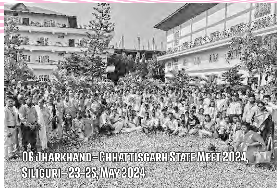
06 JHARKHAND - CHHATTISGARH STATE MEET 2024, SILIGURI - 23-25, MAY 2024