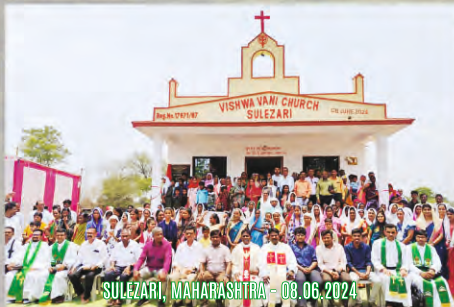
SULEZARI, MAHARASHTRA - 08.06.2024