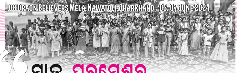
08 ORAON BELIEVERS MELA, NAWATOLI, JHARKHAND - 05-07 JUNE 2024