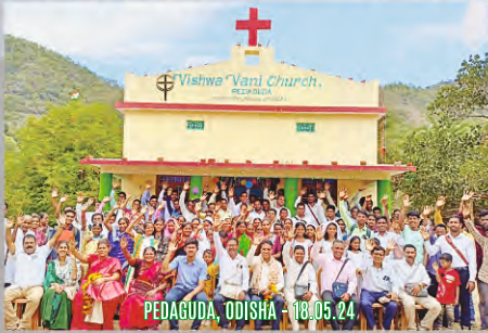
PEDAGUDA, ODISHA - 18.05.24