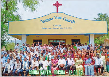
SOURA PAILEM, ODISHA - 12.08.24

THE GIFT GIVEN BY HEAVENLY FATHER FOR THOSE WHO PROCLAIM AND ACCEPT LORD JESUS AS THEIR SAVIOUR - WORSHIP, CHURCH, FELLOWSHIP AND POWERFUL MINISTRY. TIME HAS COME WHERE PEOPLE ARE WORSHIPING THE LORD EVERYWHERE. PRAISE THE LORD!