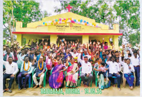
BAIDABAJA, ODISHA - 19.05.24