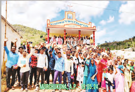
MURCHUKONA, A.P. - 19.05.24