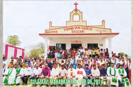
SULEZARI, MAHARASHTRA - 08.06.2024