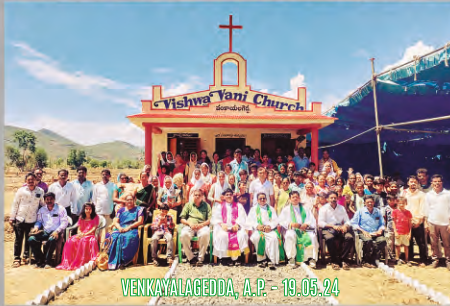
VENKAYALAGEDDA, A.P. - 19.05.24