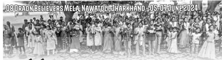
08 ORAON BELIEVERS MELA, NAWATOLI, JHARKHAND - 05-07 JUNE 2024