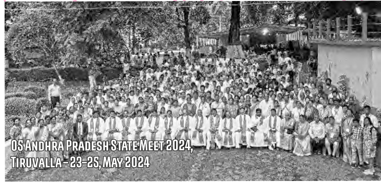
05 ANDHRA PRADESH STATE MEET 2024, TIRUVALLA - 23-25, MAY 2024

ഈ വിത്തുകൾ 30, 60, 100 മേനിയായി ഫലം നൽകട്ടെ.