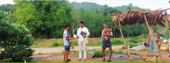
To see the glorious gospel of our Lord and Saviour Jesus Christ blessing villages in India