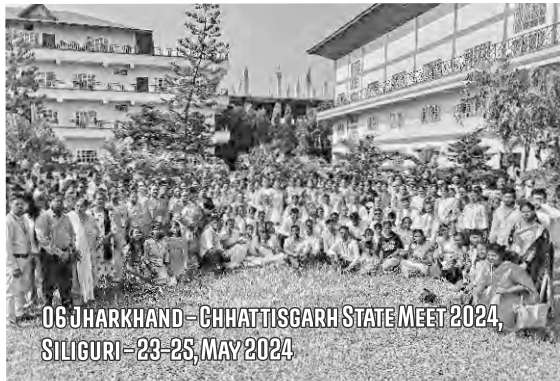
06 JHARKHAND - CHHATTISGARH STATE MEET 2024, SILIGURI - 23-25, MAY 2024