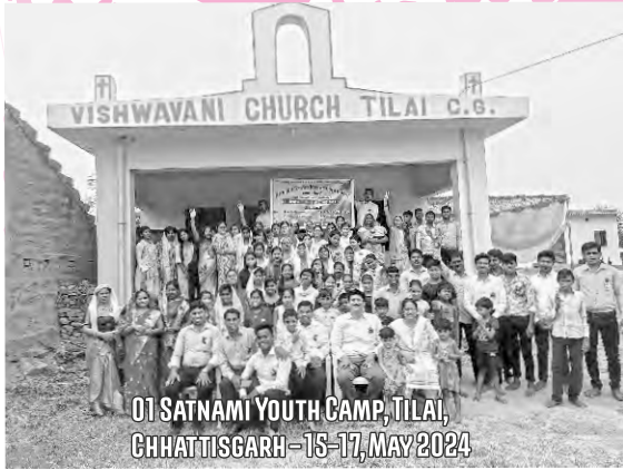
01 SATNAMI YOUTH CAMP, TILAI, CHHATTISGARH - 15-17, MAY 2024

മിഷനറിമാർ 1 ലക്ഷം ഗ്രാമങ്ങളിൽ എത്തുകയും ദൈവരാജ്യത്തിന്റെ സുവിശേഷം പങ്കുവെയ്ക്കുകയും ചെയ്യുന്നതുവരെ ദൈവമക്കൾ ഒരുമിച്ചു കൂടെ!