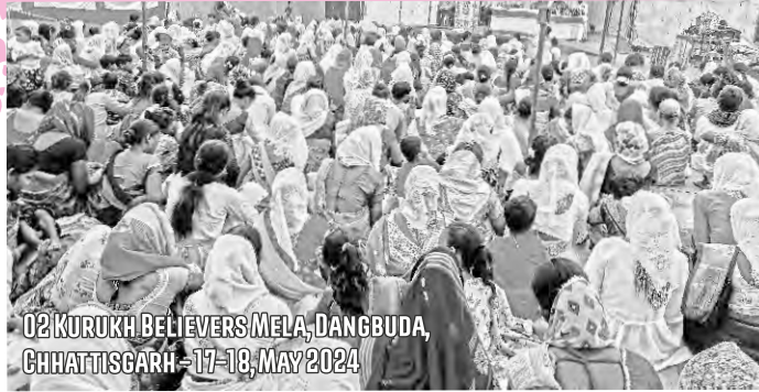
02 KURUKH BELIEVERS MELA, DANGBUDA, CHHATTISGARH - 17-18, MAY 2024