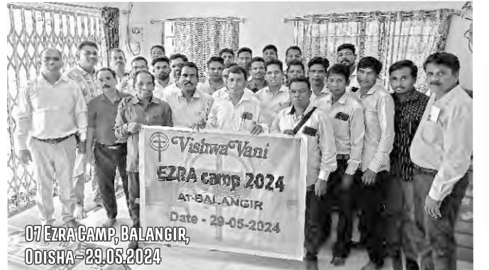
07 EZRA CAMP, BALANGIR, ODISHA - 29.05.2024