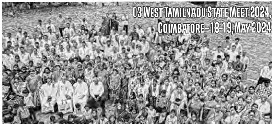
03 WEST TAMILNADU STATE MEET 2024, COIMBATORE - 18-19, MAY 2024