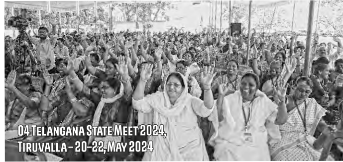
04 TELANGANA STATE MEET 2024, TIRUVALLA - 20-22, MAY 2024

സ്റ്റേറ്റ് മീറ്റിംഗുകൾ, വിവിധ ജനവിഭാഗങ്ങളുടെ കൺവെൻഷനുകൾ, എസോ ക്യാമ്പുകൾ, യുവാക്കളുടെ പരിശീലന ക്ലാസ്സുകൾ എന്നീ കൂടിവരവുകളിൽ ശുശ്രൂഷയുടെ ദർശനവുമായി ബന്ധപ്പെട്ട വിത്തുകൾ വിതയ്ക്കുന്നു!