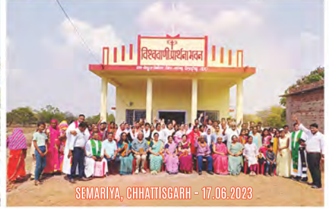
SEMARIYA, CHHATTISGARH - 17.06.2023