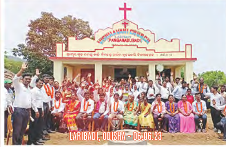
LARIBADI, ODISHA - 06.06.23