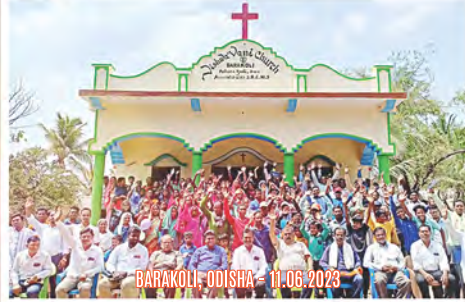
BARAKOLI, ODISHA - 11.06.2023