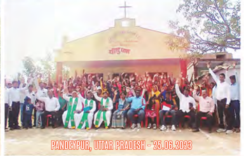
PANDEMPUR, UTTAR PRADESH - 25.06.2023