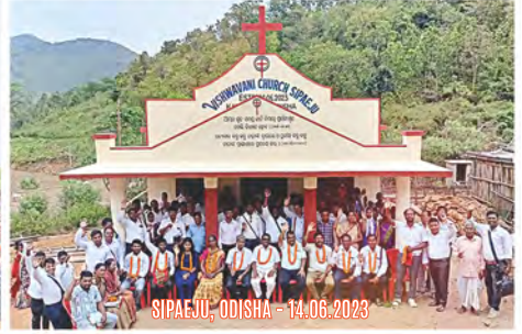
SIPAEJU, ODISHA - 14.06.2023