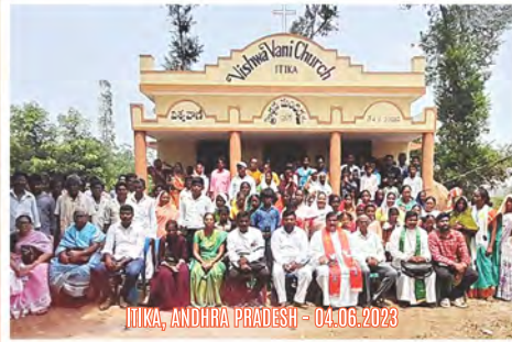
ITIKA, ANDHRA PRADESH - 04.06.2023

Kitungan Aberman Batte Bangsa Anoblingan Susule Girjangan gutulle Swrped Gaerben Asan Tangoran Rzlen Asan Kitungan Sanen Senan De-eti.