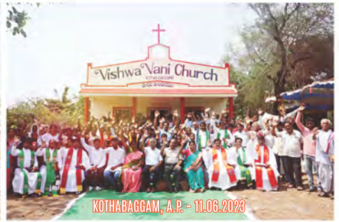
KOTHABAGGAM, A.P. - 11.06.2023