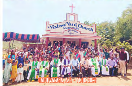
GADIVALASA, A.P. - 11.06.2023